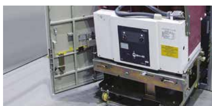
Выкатной элемент с выключателем HVX-40