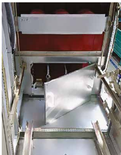
Съёмная перегородка в отсеке выкатного элемента

В стандартном исполнении в отсеке линейных присоединений размещается до 6 трёхжильных кабелей или до 6-ти комплектов одножильных кабелей с датчиками тока нулевой последовательности.