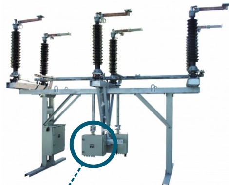
Разъединитель РН-СЭЩ-110 кВ с цифровым приводом